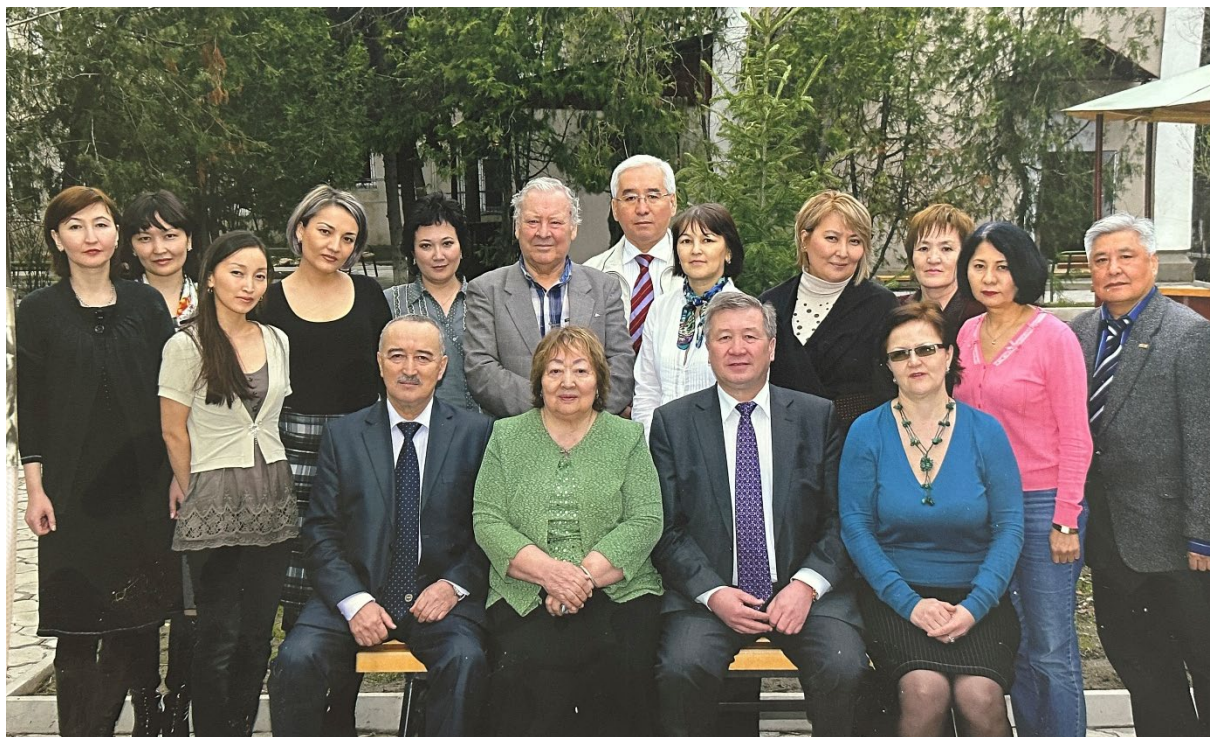
Профессорско–преподавательский состав кафедры психиатрии и наркологии имени Г.И. Зальцмана

В настоящее время кафедра входит в число ведущих образовательных и научных центров Казахстана в области психиатрии и наркологии. Кафедра активно занимается научными исследованиями и издательской деятельностью, публикуя учебники, монографии и методические материалы на русском, казахском и английском языках. Также поддерживается активное международное сотрудничество с ведущими университетами и научными центрами.